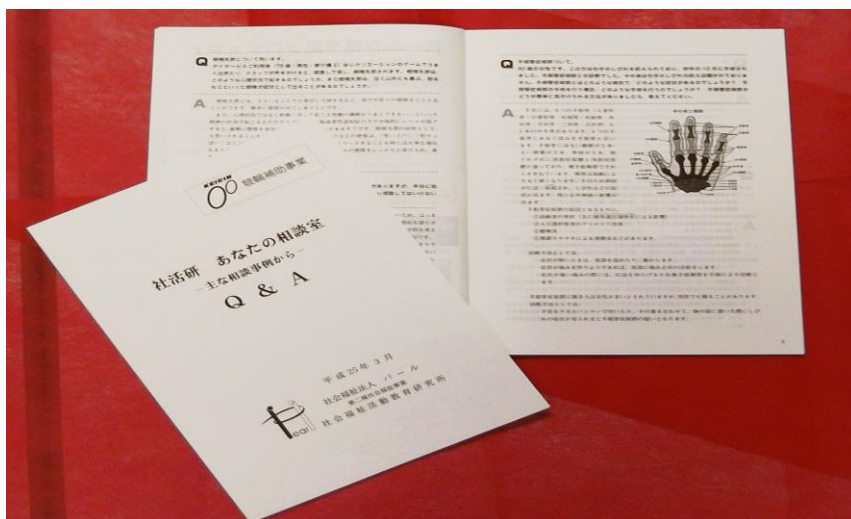
・社活研 あなたの相談室「主な相談事例から Q&A」報告書